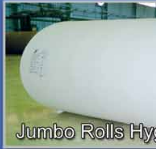
Jumbo Rolls Hyg