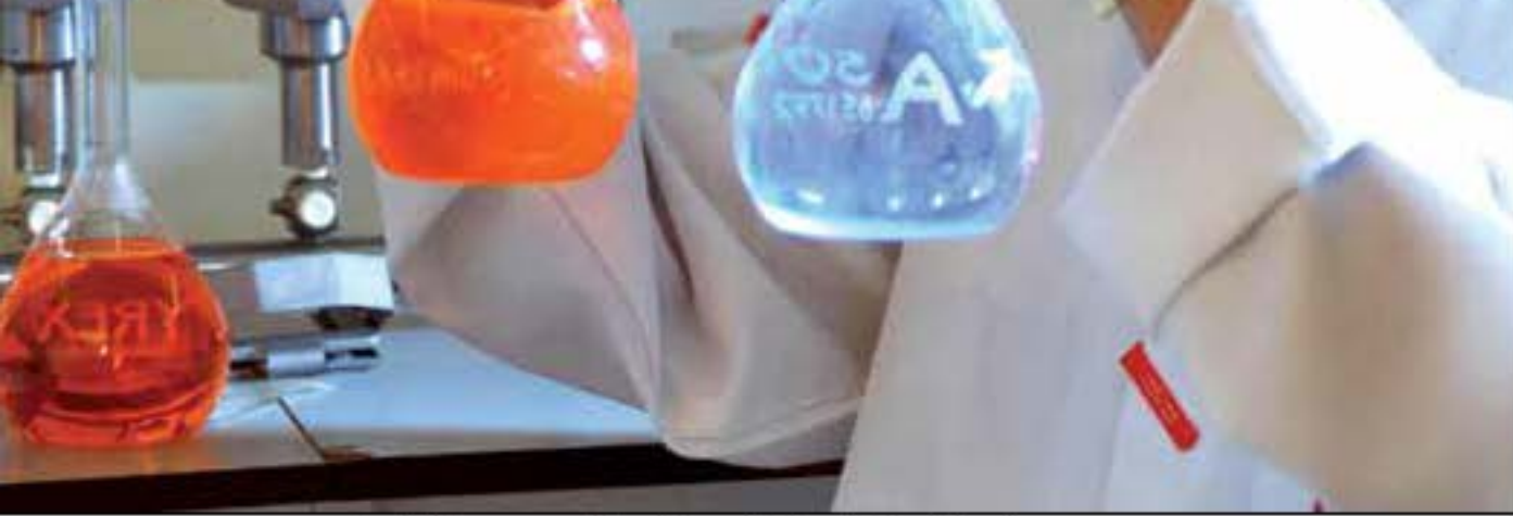
المواشي تمتلك مختبرات متطورة لفحص جودة المنتجات

فيصل البدر: الحكومة تدعم الصناعة والدليل جهود وزير التجارة و مدير عام هيئة الصناعة لتطوير القطاع