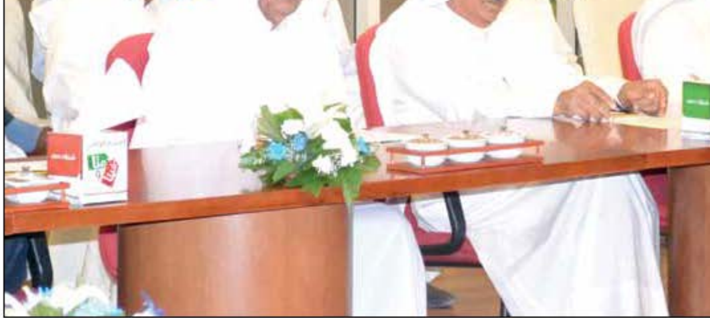
المصانع تأثرت سلباً في قرار زيادة رسوم الإفراج الجمركي.. فمن يغيثها؟