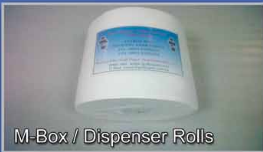
M-Box / Dispenser Rolls