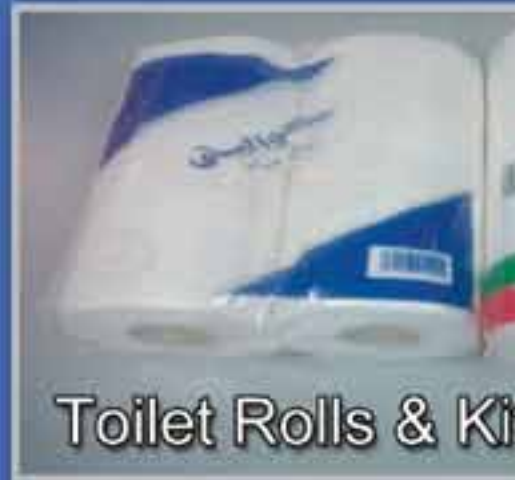
Toilet Rolls & Ki