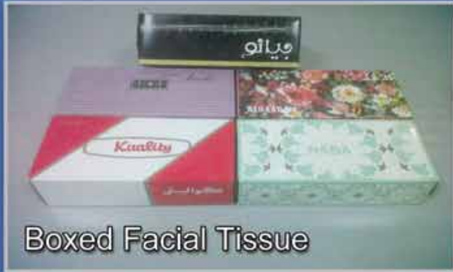
Boxed Facial Tissue