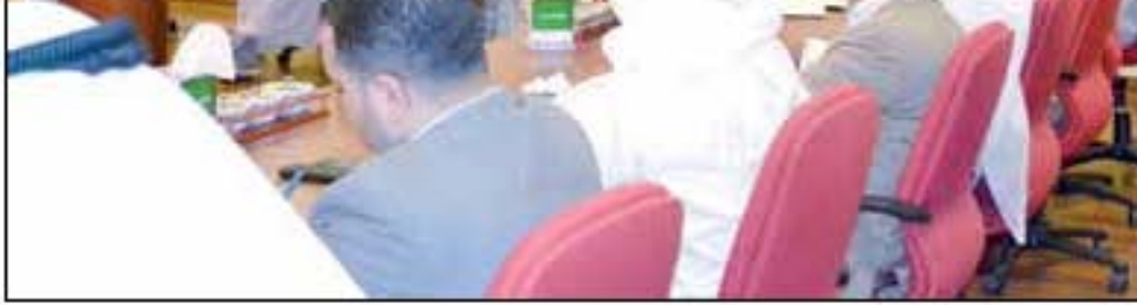
مدير عام الاتحاد هند الصبيح تشرح جهود الاتحاد لاحتواء تداعيات القرار