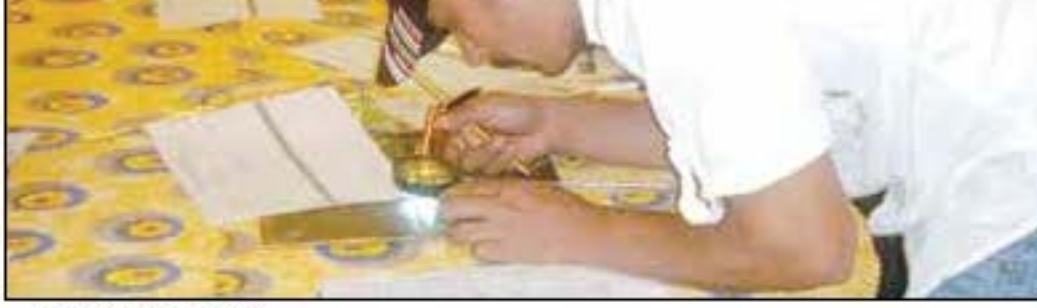
خلال البرنامج التدريبي

في التأهيل المهني في عامي»، وحضر البرنامج تقني عمليات اللحام شقيق الجودة في مجالات تولي الإنتاج الصناعي. خ التدريب العبد من مليحة، والوسائل الموثقة لعمليات اللحام من