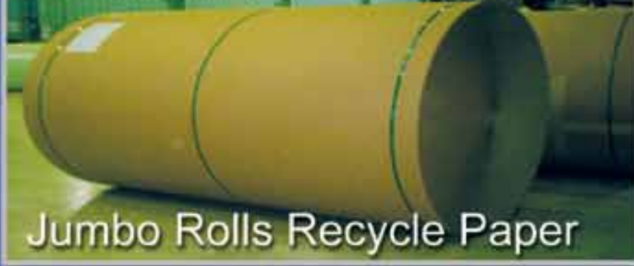
Jumbo Rolls Recycle Paper