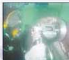
Underwater Ship Services