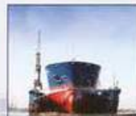
Vessel in Floating Dock