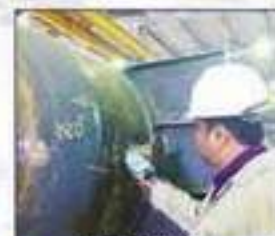
Quality Control and Testing Services