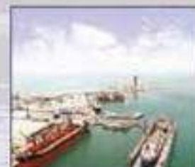
Aerial Overview of Shipyard